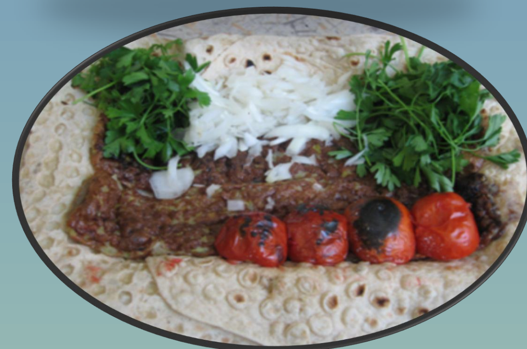
کباب کوبیده ماهی