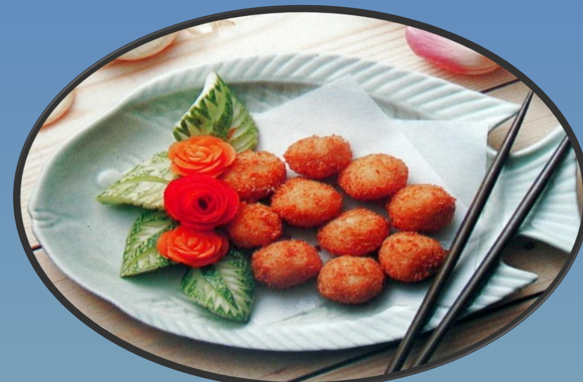
فیش بال سوخاری