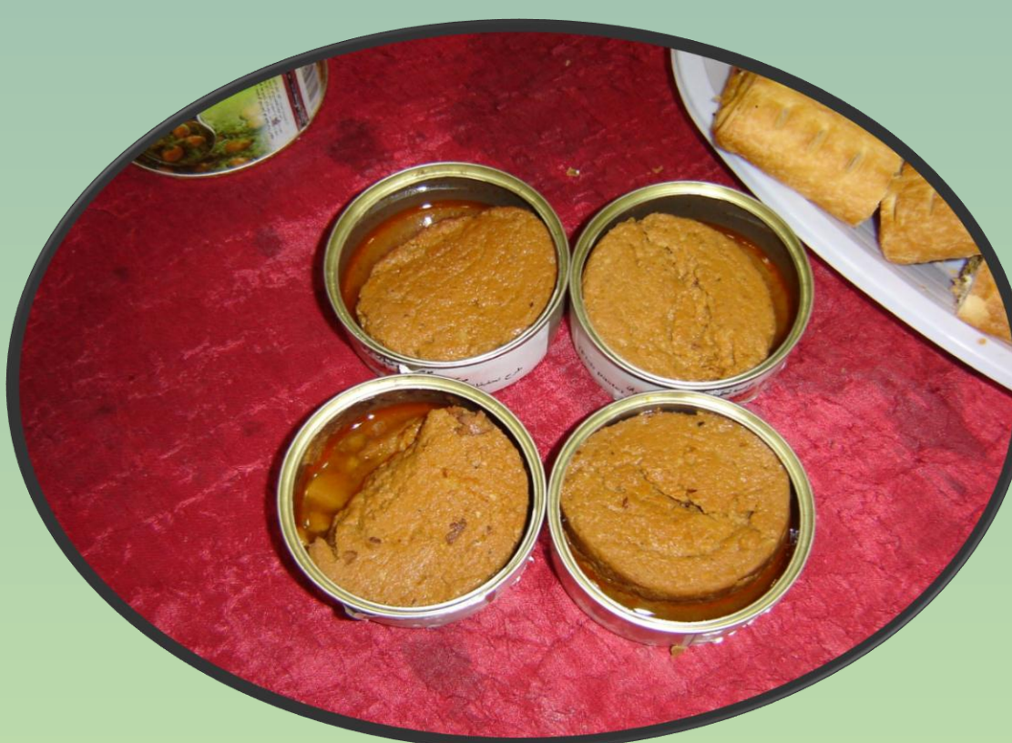
فیش پیست (خمیر آماده مصرف ماهی)