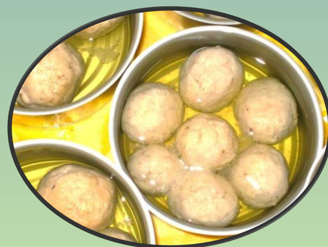
کنسرو کوفته ماهی در روغن