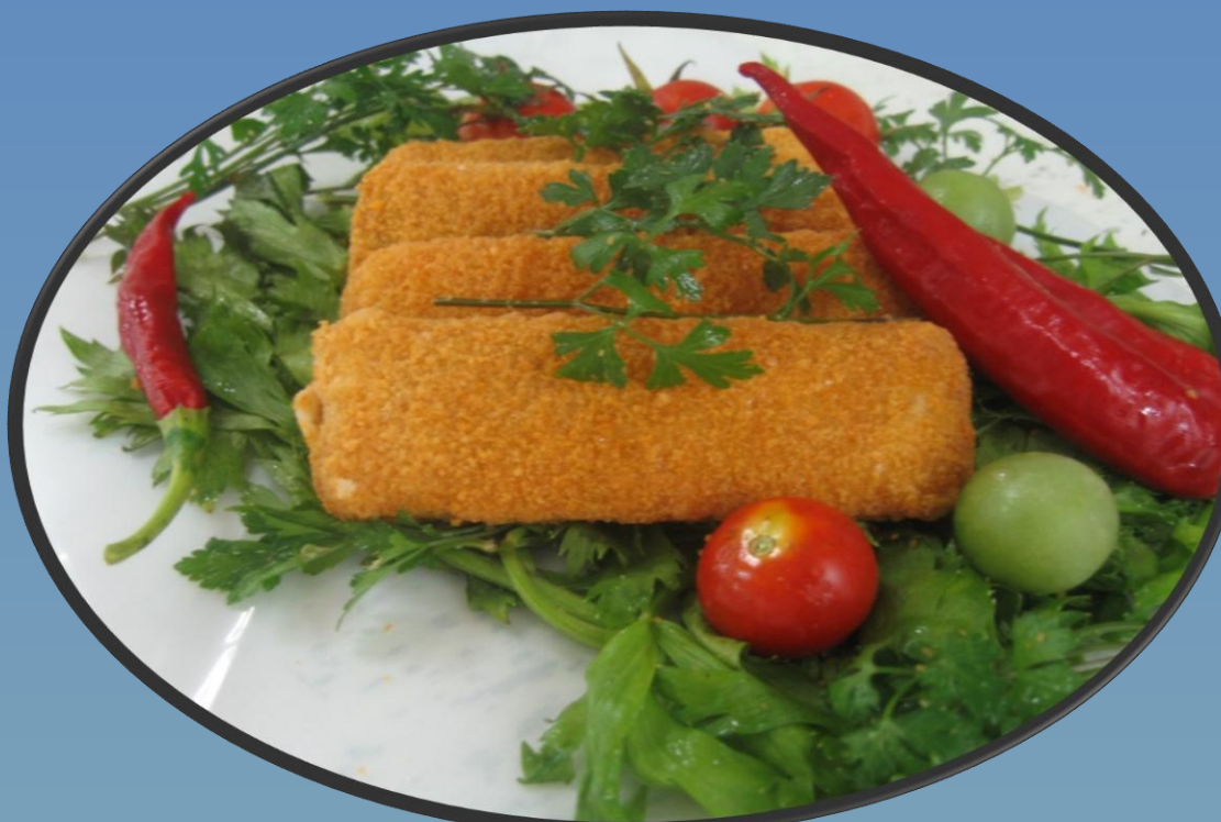
کباب لقمه ماهی